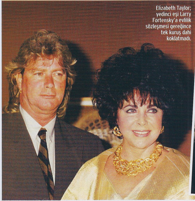
Elizabeth Taylor; yedinci eşi Larry Fortensky'ya evlilik sözleşmesi gereğince tek kuruş dahi koklatmadı.