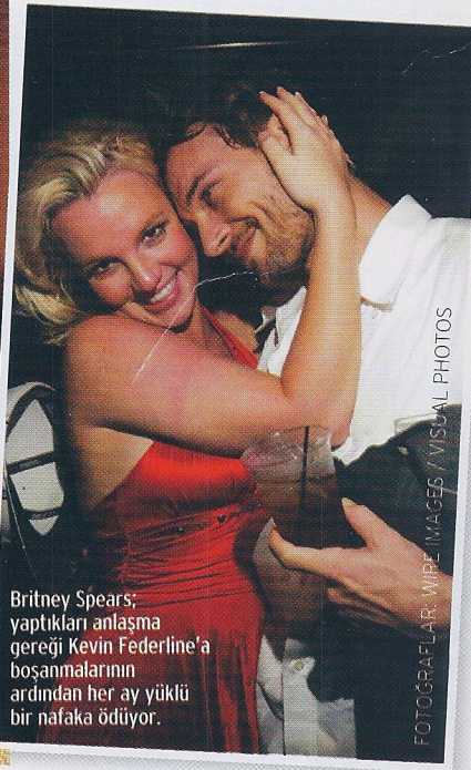
Britney Spears; yaptıkları anlaşma gereği Kevin Federline'a boşanmalarının ardından her ay yüklü bir nafaka ödüyor.