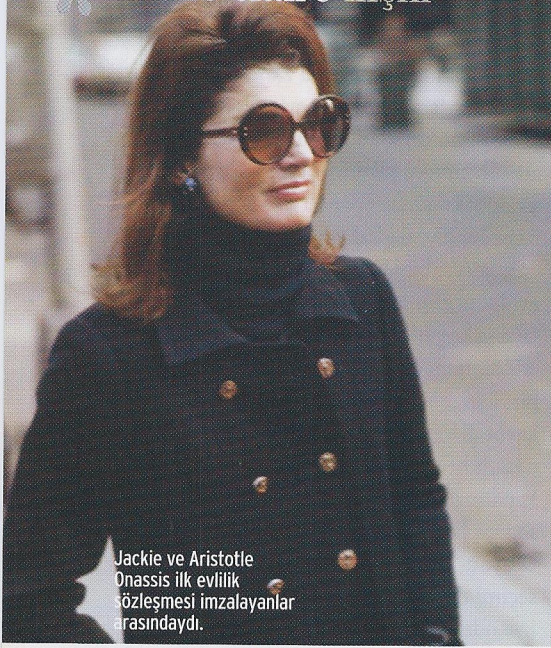
Jackie ve Aristotle Onassis ilk evlilik sözleşmesi imzalayanlar arasındaydı.