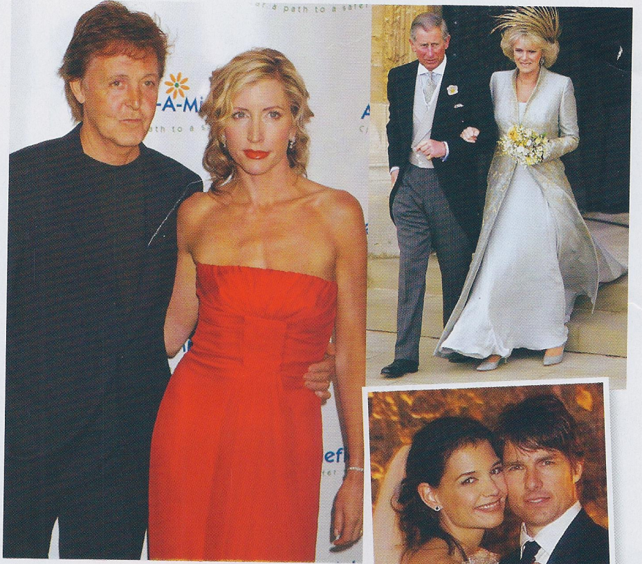
(Üstte) Paul McCartney ve Heather Mills evlilik sözleşmesi imzalamadıkları için boşanma süreçleri de çok sancılı oldu. (Üstte sağda) Prens Charles; Camilla Parker Bowles ile evlilik anlaşması imzalamayı reddetti. (Altta) Tom Cruise ve Katie Holmes da evlilik sözleşmesi yapanlardan...

Üç tane çocuğu olan bir müvekkil çocuklarının annesi olan ilk eşi tarafından internette tanışıp görüştüğü biri ile aldatıldı ve bu nedenle de boşandılar. Çocukların velayetini baba alırken, bir süre sonra müvekkilimiz yeni biriyle tanıştığını ve evlenmek istediğini dile getirdi. Gerek ilk evliliğinin aldatılmayla bitmesi gerekse üç çocuğunun da hayatlarını garanti altına alacak miktarda mal varlığı bırakmak isteyen müvekkil, ikinci eşiyile evlilik sözleşmesi yapmak istedi. Bu sayede, eğer boşanırlarsa evlilik sırasında edineceği mallardan, ev kadını olan müstakbel eşine pay vermek zorunda kalmayacak ve mallarının çocuklarına kalmasını sağlamış olacaktır. Mal ayrılığını kabul ettiklerine ilişkin bir sözleşme yaptılar ve evlendiler. ■